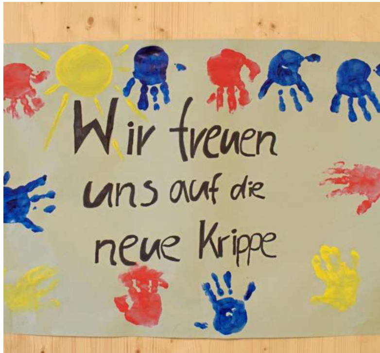
Die Vorfreude ist riesig: Die Kinder können es kaum erwarten, ihre neuen Räumlichkeiten endlich in Beschlag nehmen zu dürfen.