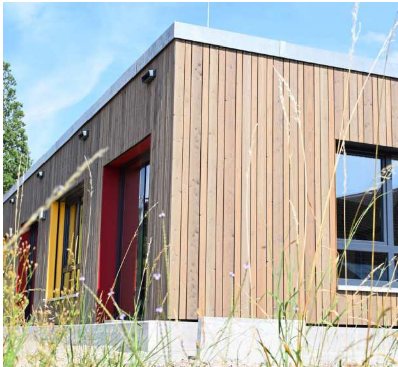
Die Kinderkrippe St. Anna verfügt über eine Holzfassade und das Flachdach wurde mit einer Photovoltaikanlage ausgestattet.