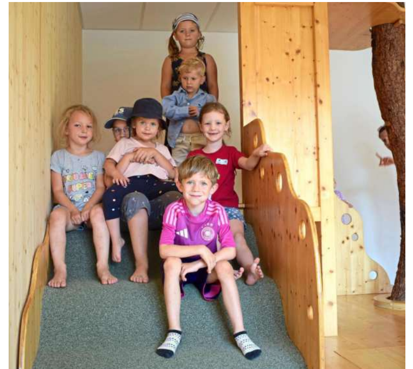
Die Gruppenräume wurden so konzipiert, dass sich der Nachwuchs rundum wohlfühlt. Dafür sorgen auch die entsprechenden Spielmöglichkeiten.